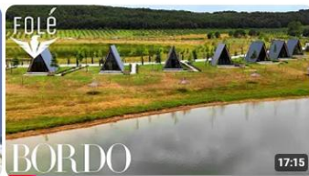
Në Belshin e 85 liqeneve, ullishteve toskane dhe historisë magjepsëse!| BORDO