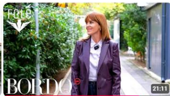
Pastat, picat, verat më të mira në Prishtinë, ku gjenden?! Zbuloheni në këtë udhëtim!| BORDO