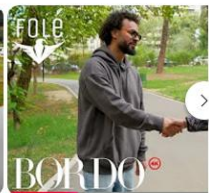
Young Zerka si baba: Besoj tek sy BORDO

Aktualisht kanali REVISTA BORDO në YOUTUBE ka gati 18k Subscriber me një audienë mijëra shikime.